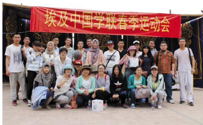
同学们参加埃及和中国学联春季运动会

游学埃及给大家带来了不一样的收获。在异国他乡，学习埃及的历史、文化，了解埃及的大学生活，认识许多新的朋友，这些都会给日后的学习带来无穷的动力。