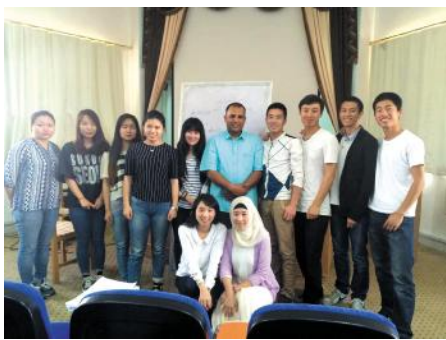
同学们参加阿语活动课

2015年2月，东语学院2012级阿拉伯语专业的3位同学前往埃及苏伊士运河大学，进行了为期4个月的游学。埃及风光秀丽，历史悠久，在这片神秘古老的国度游学，是一种什么样的体验呢？