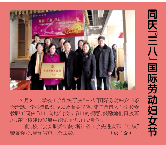
3 月 8 日,学校工会组织了庆“三八”国际劳动妇女节茶话会活动。学校党政领导以及有关学院、部门负责人与全校女教职工同庆节日,向她们致以节日的祝愿,鼓励她们再接再厉,为学校建设发展中创先争优、再立新功。

节前,校工会女职委荣获“浙江省工会先进职工组织”荣誉称号,受到省总工会表彰。(校工会)